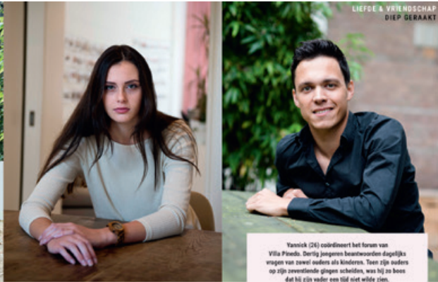
LIEFDE & VRIENDSCHAP DIEP GERAAKT