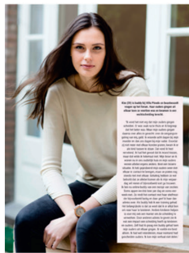
LIEFDE & VRIENDSCHAP DIEP GERAAKT